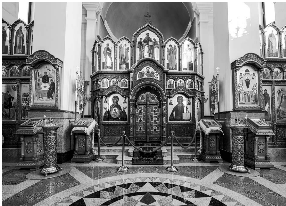
Вид верхнего придела во имя Покрова Пресвятой Богородицы.