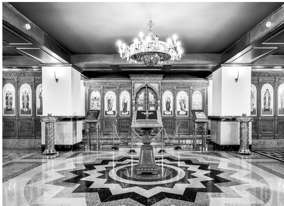
Вид нижнего придела во имя Собора новомучеников и исповедников Церкви Русской.