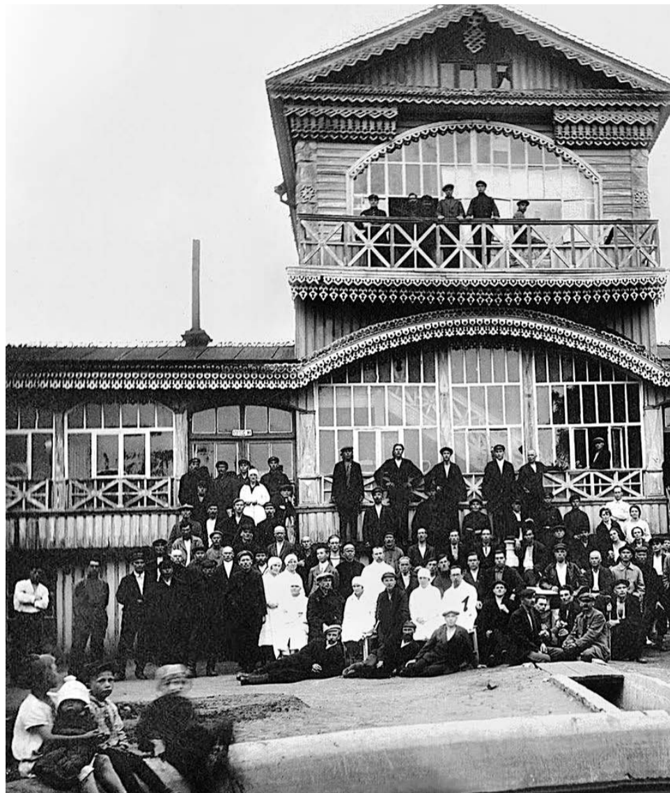
Троицк, 1930-е годы. Санаторий Уралстрахкасы (бывшая дача Яушевых).

В 1922 году монастырь закрыли. Монахини вынужденно расселились по частным квартирам, их, как служителей религиозного культа, лишили многих прав. В 1927 году все монастырские здания отдали под «культурно-просветительные нужды». С тех пор у них поменялось много хозяев, пока здания не пришли в окончательную негодность.