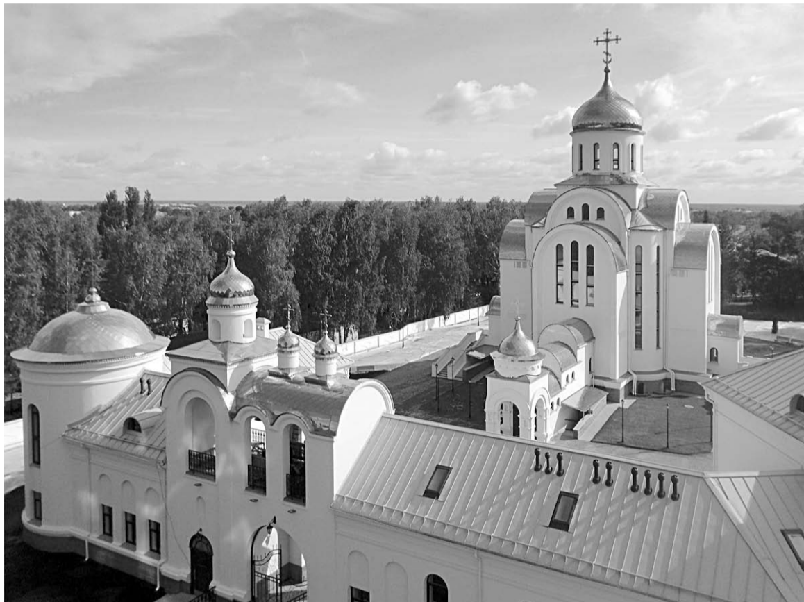
Вид на храмовый комплекс.

Вдохнуть жизнь в замершую стройплощадку удалось лишь после обращения к ак-