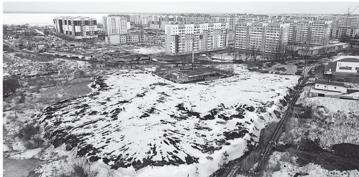
Вид на Чурилово и храм с высоты птичьего полета.

собирались отстаивать свои права, бороться, убеждать, что нам здесь нужен храм. Но ничего не пришлось отстаивать! Слушания прошли без недоразумений, мы посидели минут 10-15, все проголосовали и всё. Сказали, что разрешают отдать нам земельный участок в пользование.