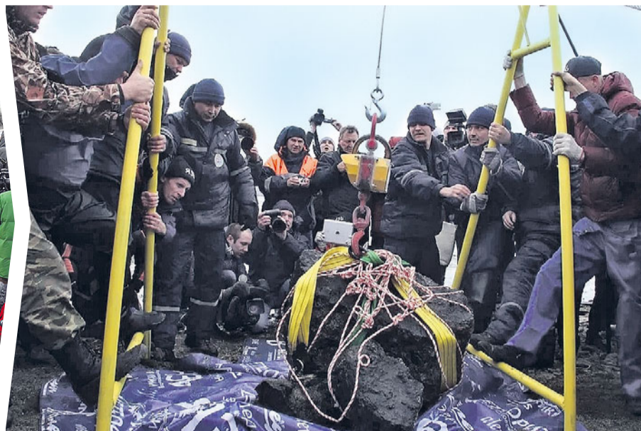
Попытка взвесить небесного гостя прямо на берегу озера.