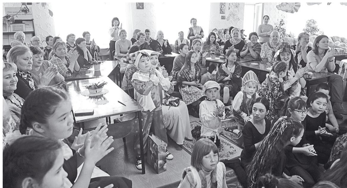
Благодарные зрители рукоплескали каждому номеру.

ке. А вот такого масштаба праздник состоялся впервые, – заметила Вера Ивановна. – Были представлены все структуры Кулуевского поселения, материально нам помогла администрация. И даже клуб выделил деньги! К нам приехали соседи из Аргаяша, Новособолево, Байрамгулово и Худайбердино. Отпраздновали, что называется, всем миром».