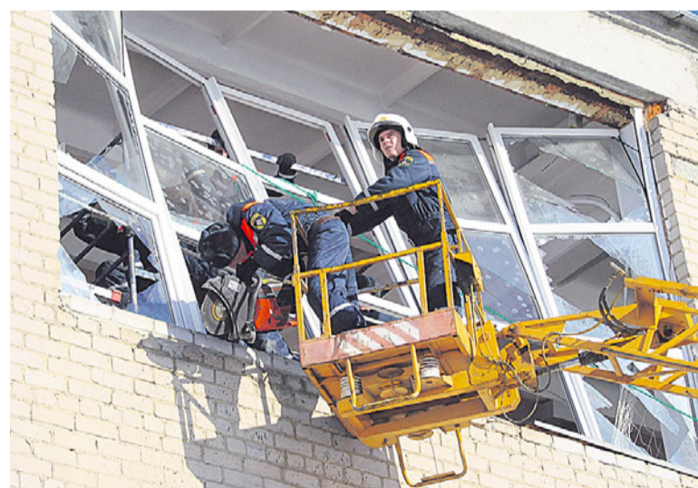
Вот так после взрыва небесного тела выглядели окна во многих зданиях Челябинска.