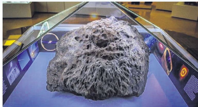
Метеорит в краеведческом музее Челябинска.

– Я точно не помню, как увидел первый кусок. Первые