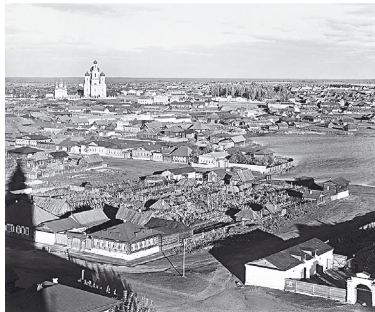
Вид на Касли. 1909 год. Фото сделано с колокольни Успенского храма. В кадре – Никольская (слева) и Вознесенская церкви.

Через несколько лет, после принятия в 1905 году закона об укреплении веротерпимости, все воочию смогли наблюдать его отрицательное