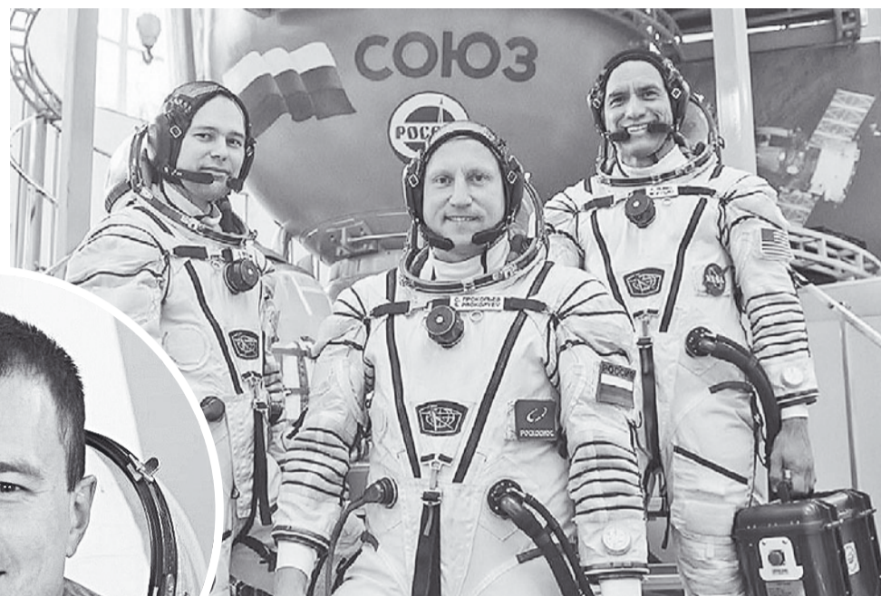
Основной экипаж МКС-68: космонавты Роскосмоса Дмитрий Петелин, Сергей Прокопьев, и астронавт НАСА Фрэнк Рубио.

– До этого я ходила, конечно, в храм, но не часто. Мы праздники отмечали, все как положено. А однажды в Аргаяше я чуть не попала под поезд. В тот день у моей мамы был день памяти, я купила хлеб, хотела раздать. Но не к тем людям попала, они сказали: мы не возьмем! И я шла такая расстроенная, не слышала даже гудок паровоза. Там как раз формировали поезд, а я переходила железную дорогу и на меня покатила сцепка вагонов. Меня спас составитель поездов: так оттолкнул, что я села на пятую точку вместе со всеми сумками. Из паровоза выскочили люди, меня ругали сильно, плохие слова говорили. И как будто меня кто-то разбудил. Шла мимо храма, у нас часовенка была тогда маленькая, увидела купол и как заплакала. Смотрю – открывается дверь, из храма выходит батюшка и спрашивает: вы что, сестра, плачете? Я говорю, у меня есть причина, чтобы плакать. Я сколько здесь ходила, не видела, что тут есть храм. Он говорит: заходи, сестра, заходи!