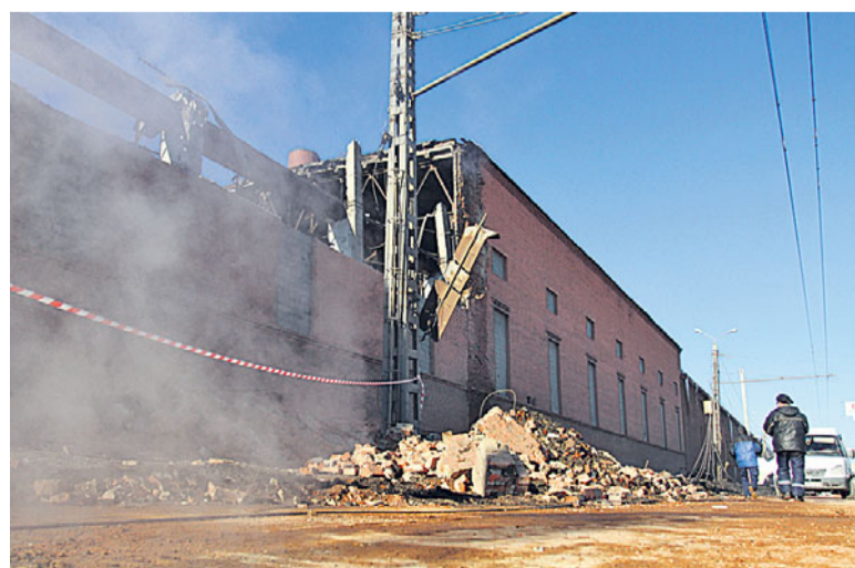
Разрушения в одном из корпусов цинкового завода.

к горению бикфордова шнура. Ещё одна аналогия – насос: если быстро сжать воздух, он нагреется. Космическое тело вторглось с гиперзвуковой скоростью – 19 км/с – поэтому воздух нагрелся примерно до 10 тысяч градусов и стал светиться, как звезда. Вот что мы видели – гиперзвуковой насос. Физикам это давно известно, поэтому других версий не рассматривалось.