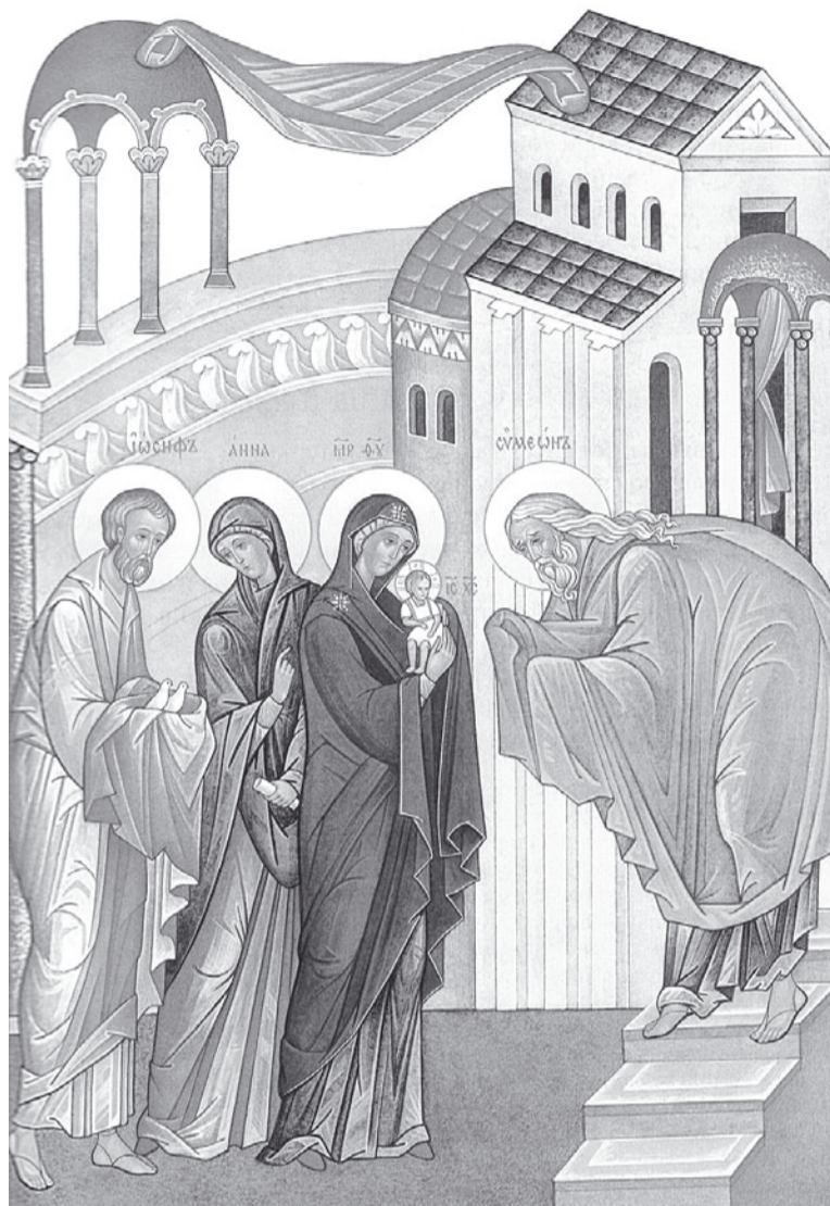
«Сретение Господне». Икона.

Этот свет воссиял Израилю на самой заре его истории: тогда с высоты Синая люди впервые услышали Божий призыв к святости, к нравственной чистоте. Нравственная составляющая десяти заповедей Моисея была даже более важной догмой, чем все постановления о богослужебных принадлежностях и ритуалах. Все жертвоприношения израильтян должны были напоминать им об одном: человек – грешен, а Бог – Свят. Жертва – знак того, что человек, погружившийся через грехопадение в духовный мрак, желает прощения и освящения. Но жертва не уничтожала грех, она всего лишь обличала его. Для того чтобы действительно быть помилованным, грешник должен иметь дух сокрушен, сердце смиренно (Пс.50), должен научиться делать добро, искать прав-