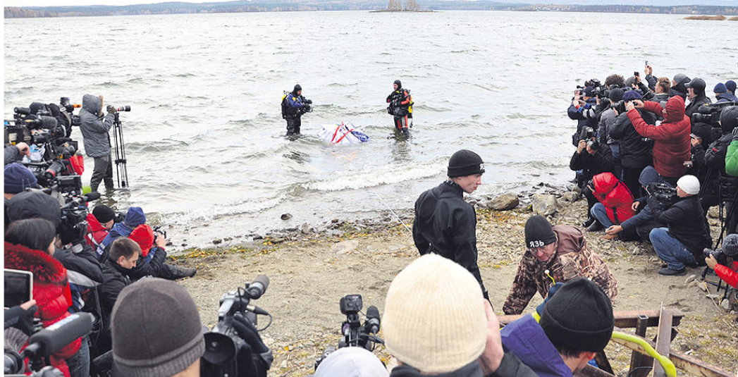
Исторический момент: водолазы подняли метеорит со дна озера Чебаркуль.