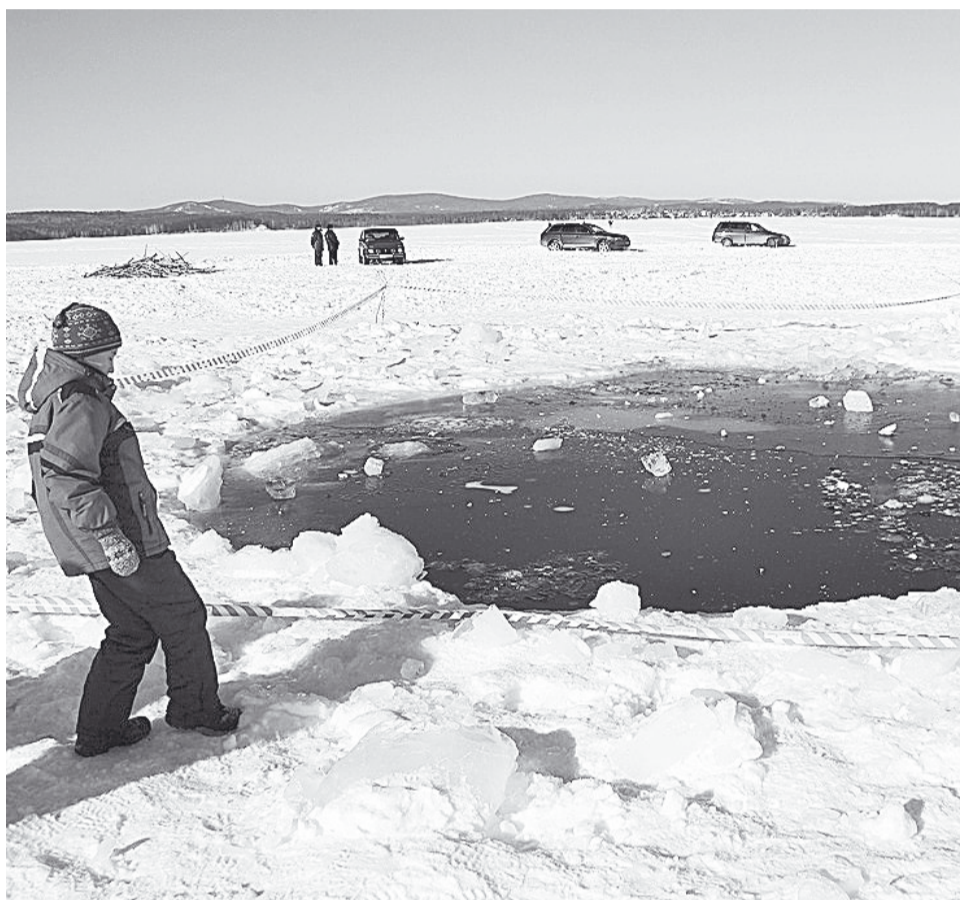
Польня от метеорита.

Итак, чудеса Божии, во-первых, добрые. Во-вторых, они адресные, то есть всегда направлены к конкретным личностям, чтобы спасти их или вра-