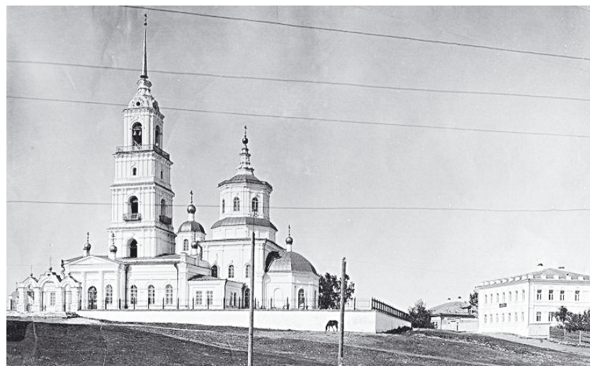
Касли. Храм Успения Божией Матери. Дореволюционный снимок.