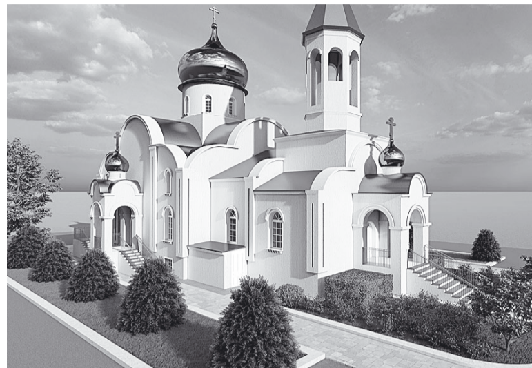
Так будет выглядеть храм Сретения Господня.

– В Челябинске были назначены общественные слушания по выделению в Чурилово земельного участка под строительство капитального храма, – рассказывает член приходского совета Светлана Небогатова. – Мы готовились,