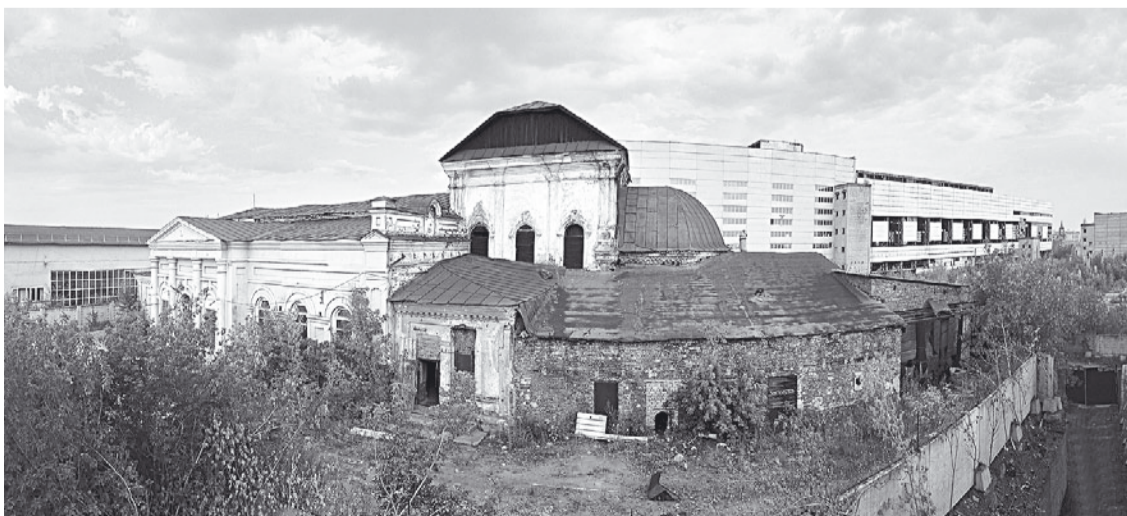
Храм Успения Божией Матери. Современный вид.