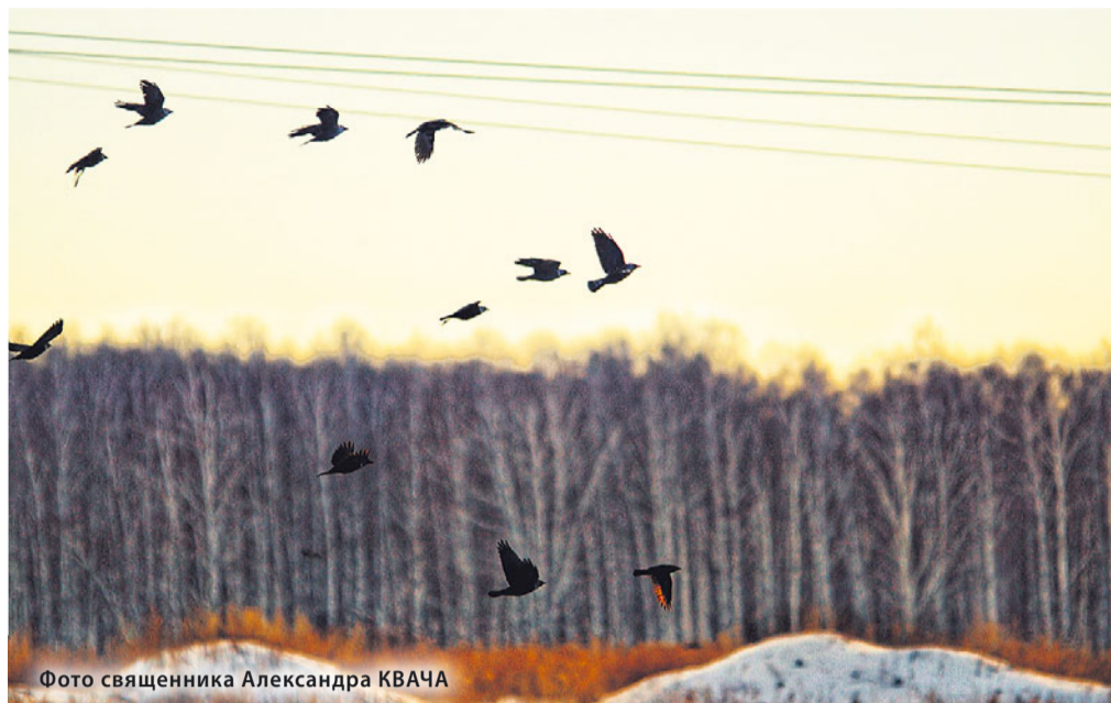
Фото священника Александра КВАЧА