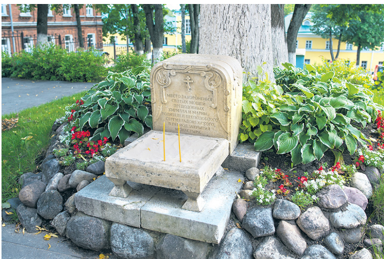
Место захоронения родителей Сергия Радонежского – преподобных Кирилла и Марии.

Затем мы отправились в Гефсиманский Черниговский