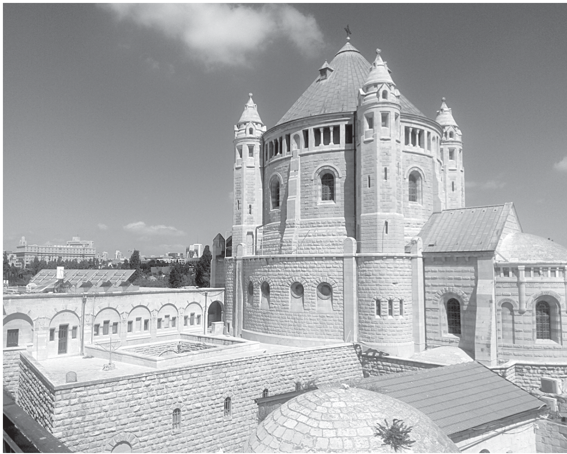
Вид с крыши Сионской горницы.

Стоит ли христианину посещать Стену плача, Храмовую гору, башню Давида и иные не-христианские чтимые места? По-моему, да, не для молитвы, а как музей. Иудаизм – всё же не язычество, а по слову апостола Павла: «Об-