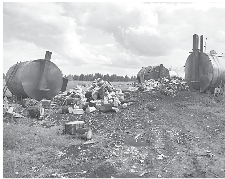
Старый-старый промысел: углежого.

вредили своей публикацией. «А то начнут тут ездить всякие!» – вздыхает равнодушная женщина.