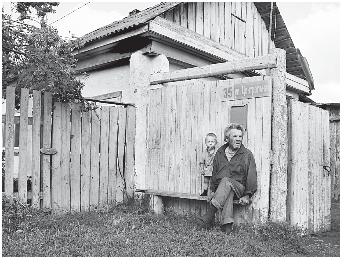
Днем в селе остаются старые да малые.