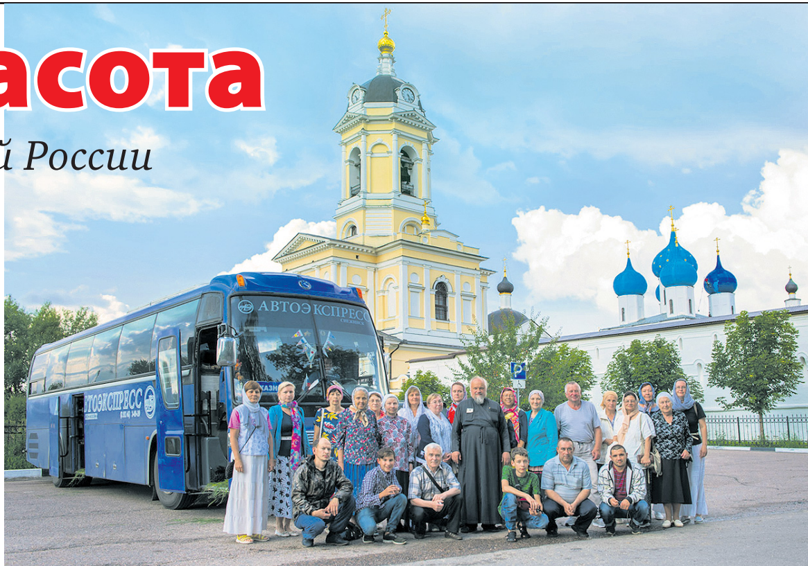
У ворот Высоцкого мужского монастыря в Серпухове.

Путь наш лежал через город Серпухов, куда мы приехали около шести вечера. Заехали в Высоцкий мужской монастырь. Следующей точкой на маршруте был город Муром. Туда мы приехали в 5 утра. Пока бо льшая часть паломников спала в автобусе, я отправился на разведку. Понимав красивый рассвет над монастырскими стенами, пошел на реку Ока, где на набережной стоит внушительных размеров памятник Илье Муромцу. Город Муром интере-