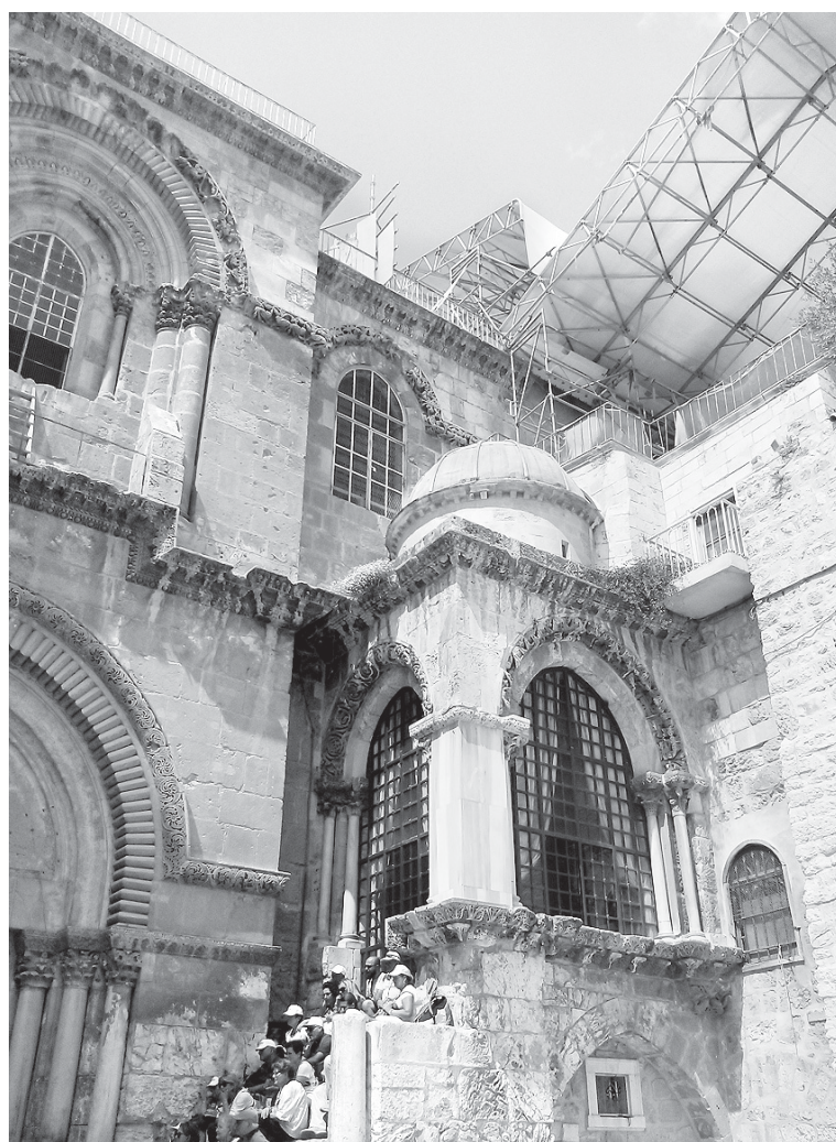
Храм Гроба Господня. Лестница.

Если выйти из Львиных ворот в сторону, противоположную Via Dolorosa, и перейти оживленное шоссе, окажешься в Гефсимании. Слева – спуск вниз, в подземный храм Успения, где покоилось