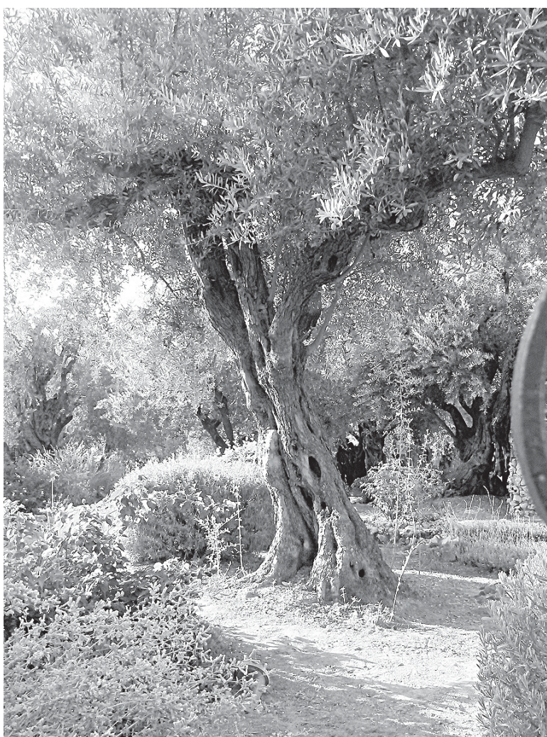
Гефсиманский сад. Дерево.

Деньги лучше всего менять на почте «Доар Израэль». В аэропорту обменников много,