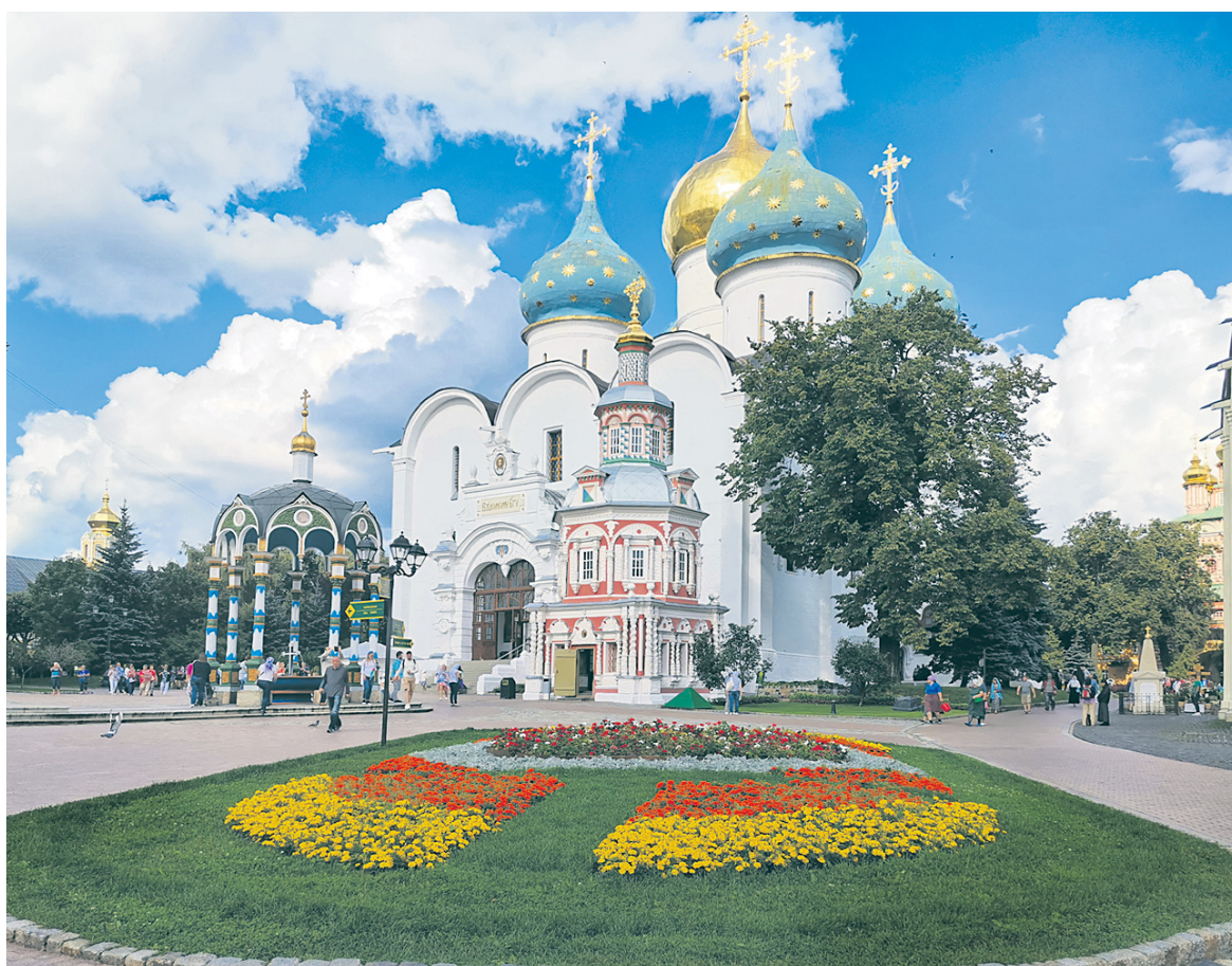
Успенский собор Троице-Сергиевой лавры.