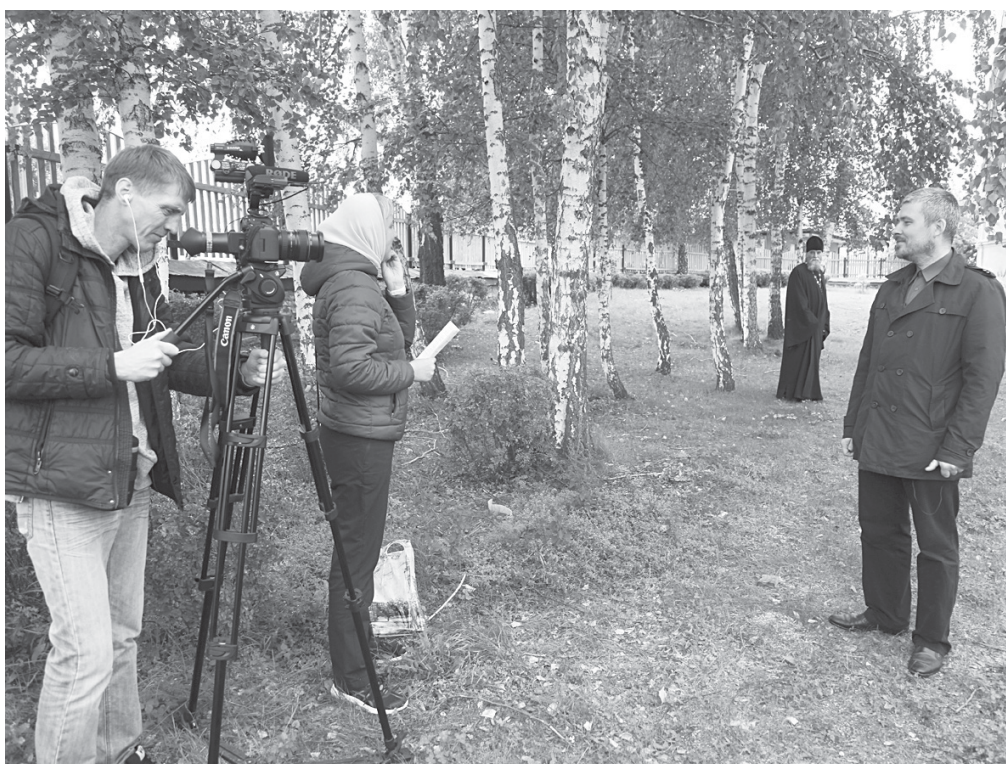
Съемочная группа за работой.