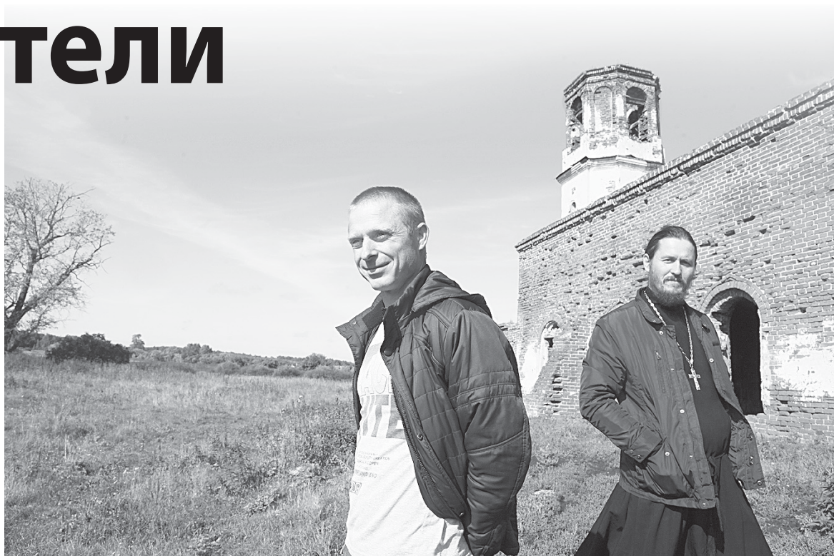
Депутат и священник.