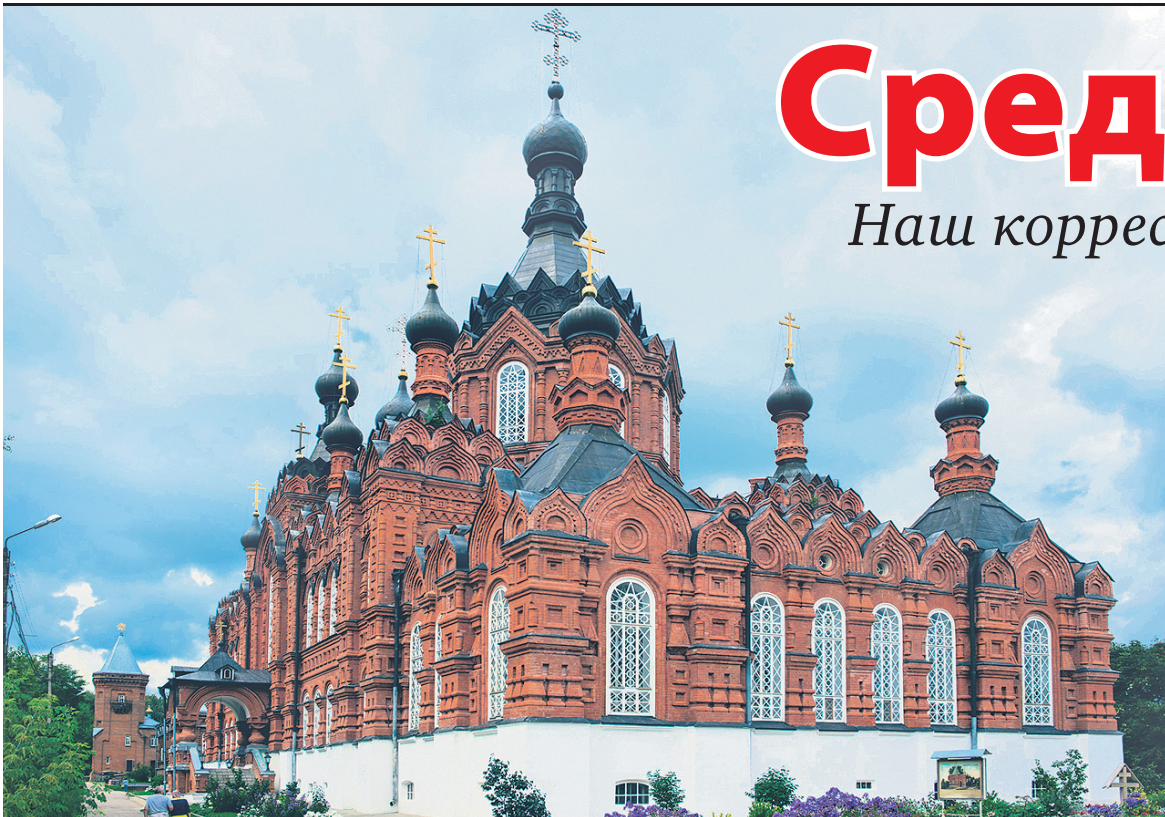
В Шамординском монастыре.