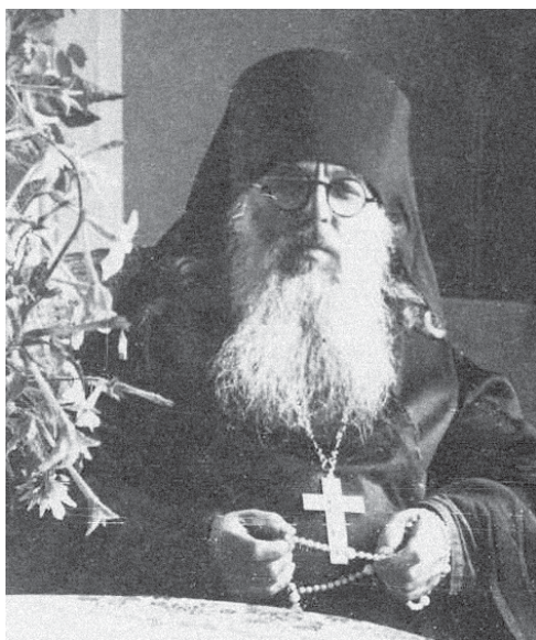
Архимандрит Серафим Урбановский.

Снять фильм и написать книгу об архимандрите Серафиме Урбановском – такое непростое задание информационно-издательский отдел Челябинской епархии получил от митрополита Григория. С чего начать? Что мы о нем знаем? Изучая его биографию, мы поняли, что работа предстоит серьезная.