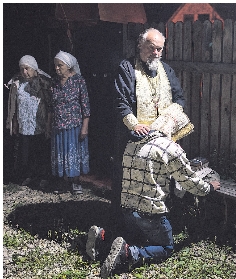
Исповедь во дворе.

сен, в первую очередь, своей старинной архитектурой. Широкие кривые улочки, старинные дома, множество старинных храмов и монастырей, почти полная безлюдность в 5 утра – всё это было так не похоже на обычное утро в других городах. В 6.30 мы пошли в монастырь, где приложились к мощам преподобных Петра и Февронии Муромских. Затем, почти не задерживаясь, поехали в Спасо-Преображенский мужской монастырь. Здесь, в Спасо-Преображенском соборе слева от алтаря, находится гробница Ильи Муромца: резной саркофаг с точной скульптурой преподобного, в которую вставлена часть мощей левой руки. Поклонившись святыне, отправились в дальнейший путь.