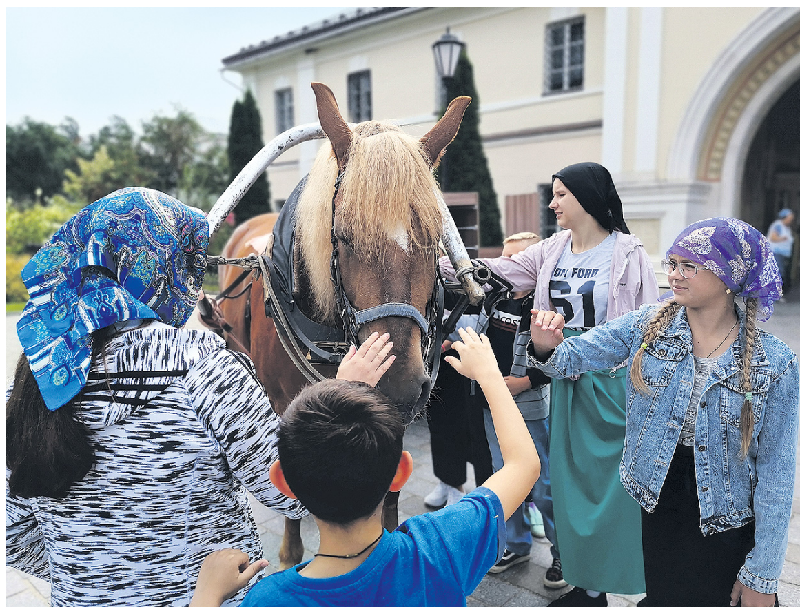
В Оптиной пустыни. Монастырский транспорт.